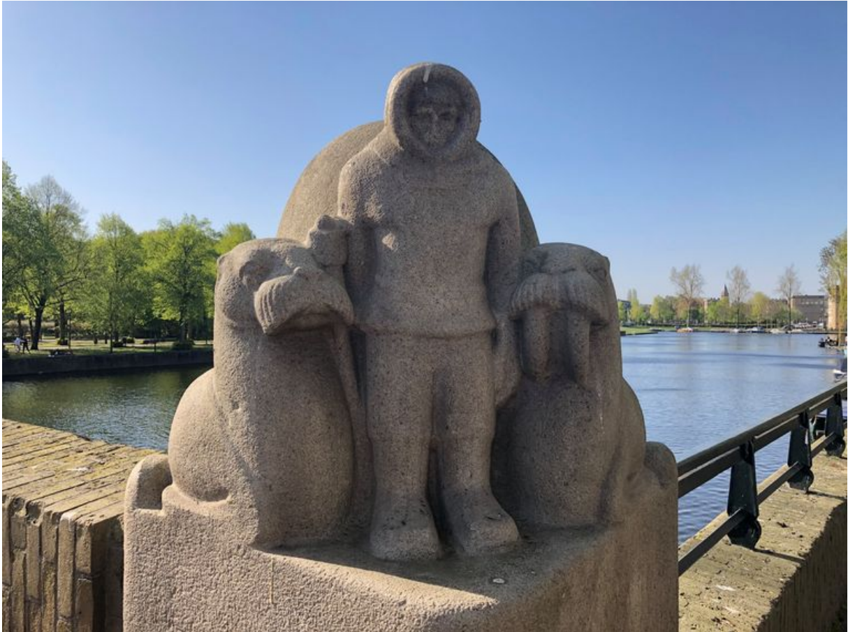
Beeld Gijs Stork

mannetje met de telefoon (de Amerikaanse beurshandelaar die voor het Westen staat) of de Eskimo met iglo en walrus (het Noorden), stereotypen waar je nu niet meer mee wegkomt. Beeldhouwer Jan Trapman verbeeldde het Oosten en Zuiden met de tijger en de ijsbeer op de trappen naar het park.