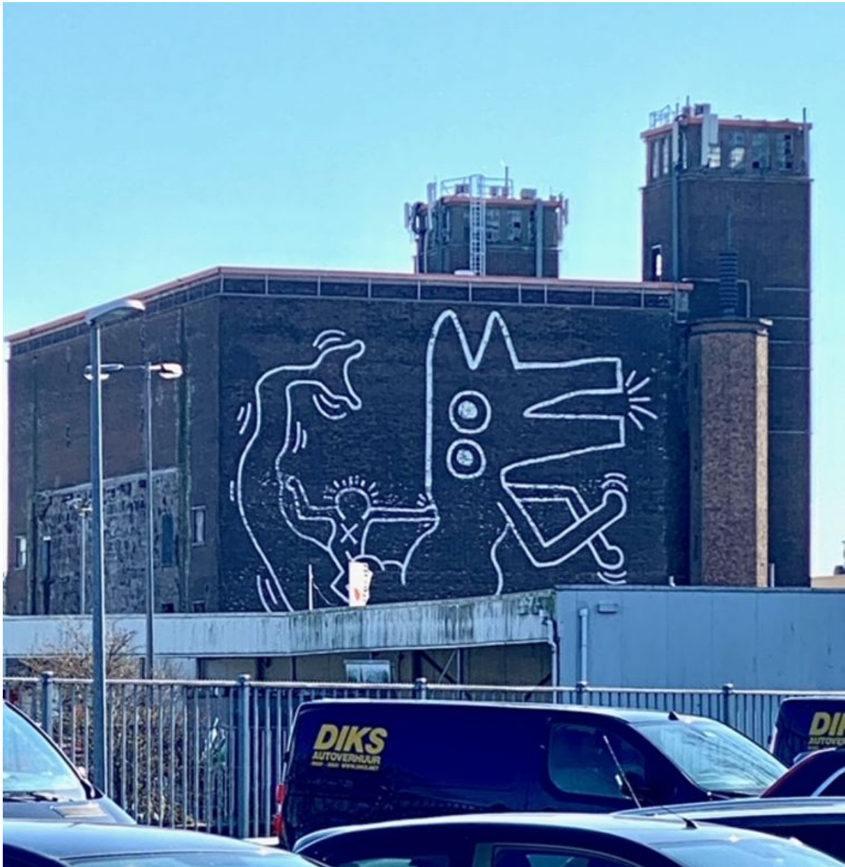
Beeld Gijs Stork