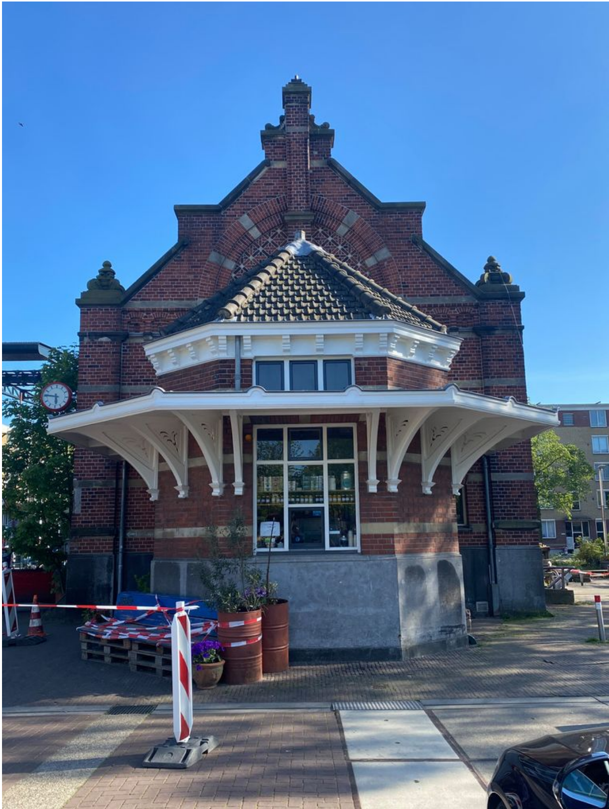
PS 13 april 2020 De Wandeling