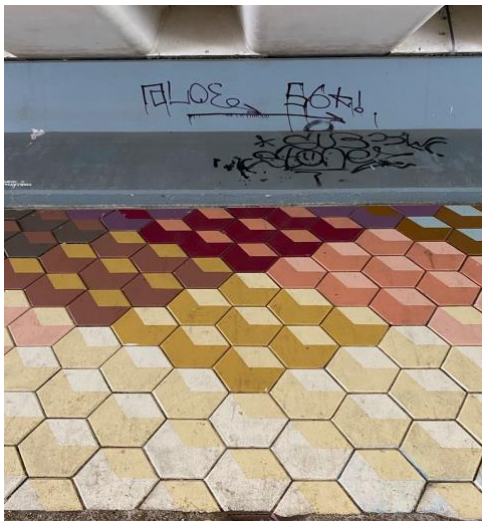
De onderdoorgang van de Parlevinkerbrug.