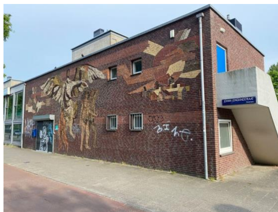
Mozaïek van bakstenen van Harry Op de Laak.