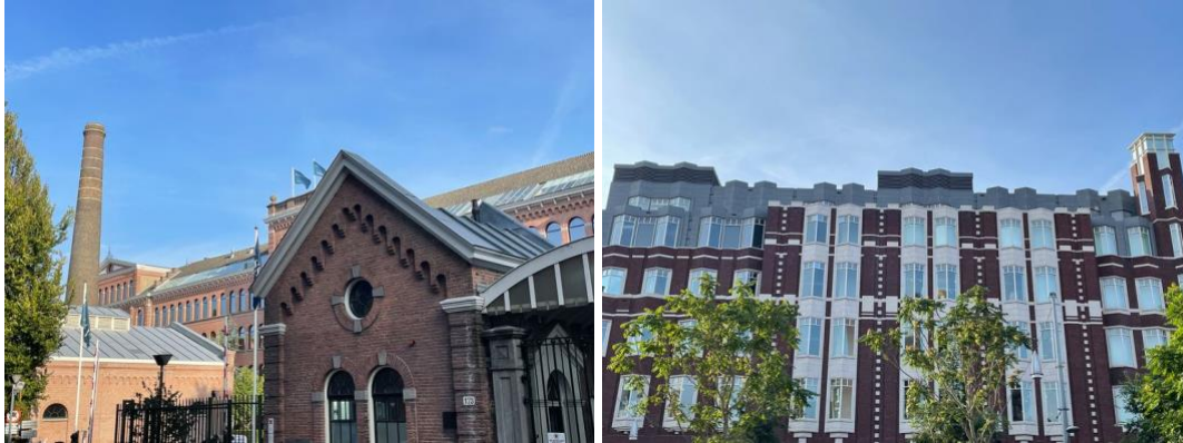
In de Nieuwe Uilenburgerstraat hebben de poorthuisjes bij Gassan Diamonds een zinken dak het dak van C&A.