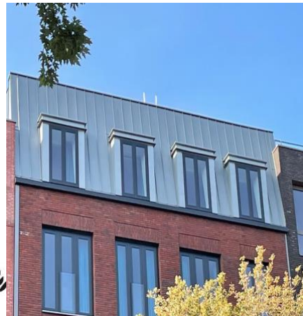
De moderne zinken daken boven op het Ibishotel.