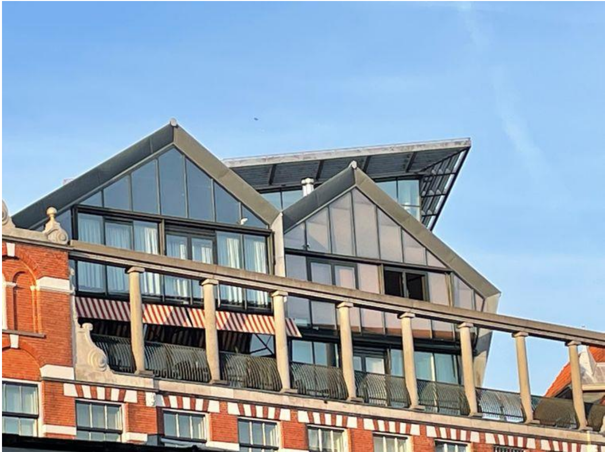
De daken van de Kalvertoren.B

J. We lopen terug via de Bloemenmarkt om de daken van de Kalvertoren te bewonderen; het lijkt wel een meesterproef van zink, omdat werkelijk alle vormen en mogelijkheden hier zijn toegepast.