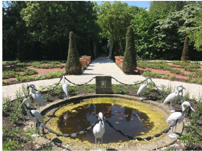
De vijver in Park Frankendael.

J. Vanuit het Oosterpark vervolgen we onze weg naar het Kastanjeplein. Bij het oversteken zien we links op nummer 82 Het Witsenhuis liggen. Dit is het voormalig clubhuis van de Tachtigers, het kunstenaarscollectief onder leiding van Willem Witsen (1860-1923). Er worden rondleidingen gegeven en het huis wordt nu ook aan schrijvers ter beschikking gesteld.