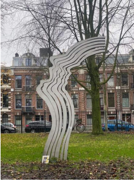
Het beeld De Schreeuw van Jeroen Henneman.