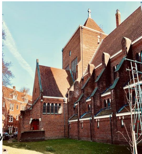
Het Linnaeushof, ook wel de Hofkerk.