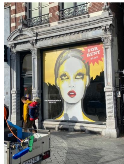
Voorheen Puck & Hans Rokin.