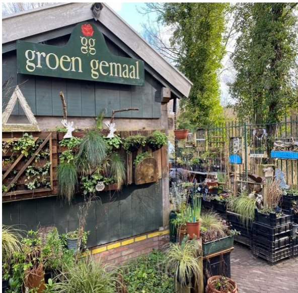
Het Groen Gemaal Sarphatipark