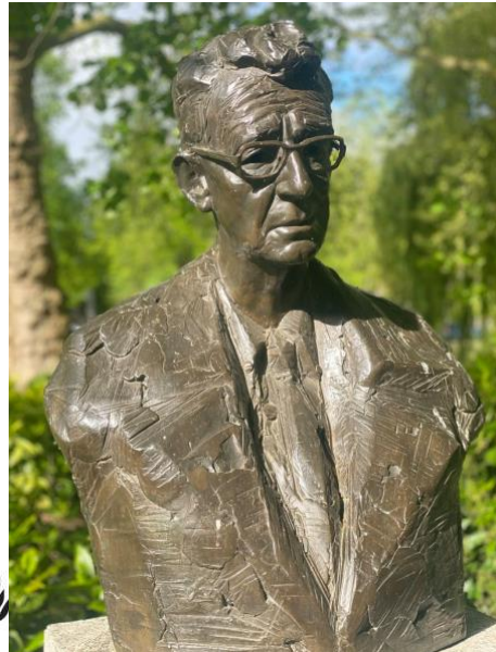
Het beeld van Simon Carmiggelt.