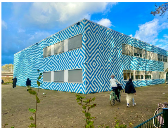
Haga Lyceum.