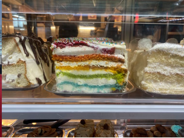
Het Zoete Stationnetje.