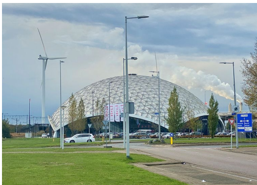
Amsterdome.