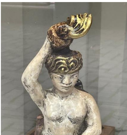
Kunst van de SBK galerie,

C. We lopen terug via de KNSM-laan, waar verderop het meeste kijkplezier begint. Op nummer 311 ligt de Kompaszaal, de voormalige aankomst- en vertrekhal van de KNSM. Het is nu een grand café, met authentiek interieur, kunstwerken en het aquarium uit Alex van Warmerdams film Ober (2006). Naast de Kompaszaal ligt de kunstuitleen en de SBK Galerie 23 voor Hedendaagse Afrikaanse Kunst. De galerie is in de afgelopen jaren uitgebreid met hedendaagse kunst uit de Caraïben en Suriname. Aan de overkant zie je rechts van het Piraeusgebouw het Mien Ruysplantsoen, dat door tuinarchitect Mien Ruys in 1958 voor de KNSM werd ontworpen. In het midden van de laan ligt nog een echt KNSM-relikwie: de fontein Amphitrite, die oorspronkelijk bij het plantsoen stond. Het KNSM-personeel schonk de fontein in 1956 aan de Scheepvaartmaatschappij voor het honderdjarig bestaan. Nadat deze in 1980 verdween in het gemeentedeput, ondernamen oud-werknemers actie om de fontein te herplaatsen. Met veel omwegen lukte dat uiteindelijk.