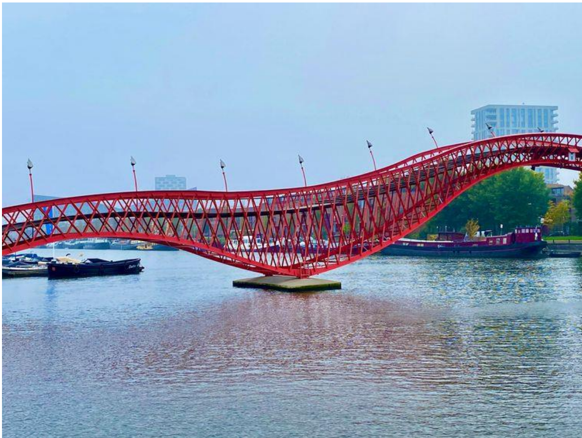
De Pythonbrug

D. We vervolgen onze weg naar Sporenburg en Borneo-eiland, een gebied dat ooit bestond uit rietlanden. In 1880 ontstonden de twee schiereilanden na het graven van een spoorwegbassin, waar havengoederen werden overgeslagen. In de jaren negentig van de vorige eeuw werd het gebied ontwikkeld door architect Adriaan Geuze van West 8. Zijn doel was een 'Jordaan aan het IJ' te bouwen. Het plan bestaat uit een mix van laagbouw en grote woonblokken. Op de kop van Sporenburg zie je de toekomstige aanlegplaats voor de tijdelijke pont die vanaf najaar 2022 vaart naar Zeeburgereiland, de nieuwe woonwijk aan de overzijde van het water. De toekomstige fietsverbinding veroorzaakt onrust bij de Sporenburgers – die vrezen voor een fietssnelweg tussen hun spelende kinderen – in tegenstelling tot de beeldengroep van kunstenaar Mark Manders die nu op de kop staat. Het werk heeft de titel Fragment van een huiskamer, verkleind naar 88% en maakt onderdeel uit van een serie beelden en kunstwerken met de naam Zelfportret van een gebouw , waar Manders sinds 1986 aan werkt. Vanuit Sporenburg lopen we over de golvende rode voetgangersbrug, de Python, die samen met de Lage brug ontworpen is door West 8. De bruggen zijn ideaal om vanaf te duiken, het water in.