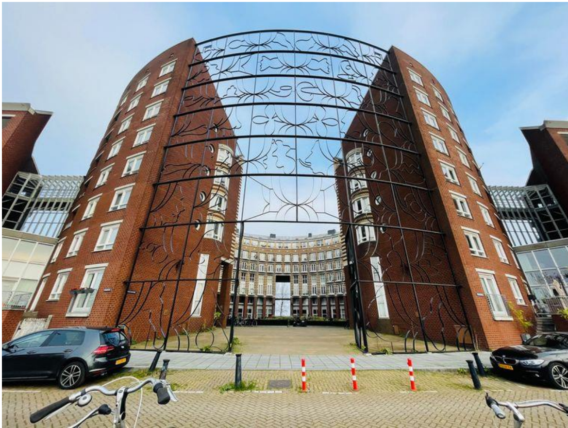
Het Barcelona plein. BEELD FLOOR VAN SPAENDONCK EN GIJS STORK

C. We lopen terug via de KNSM-laan, waar verderop het meeste kijkplezier begint. Op nummer 311 ligt de Kompaszaal, de voormalige aankomst- en vertrekhal van de KNSM. Het is nu een grand café, met authentiek interieur, kunstwerken en het aquarium uit Alex van Warmerdams film Ober (2006). Naast de Kompaszaal ligt de kunstuitleen en de SBK Galerie 23 voor Hedendaagse Afrikaanse Kunst. De galerie is in de afgelopen jaren uitgebreid met hedendaagse kunst uit de Caraïben en Suriname. Aan de overkant zie je rechts van het Piraeusgebouw het Mien Ruysplantsoen, dat door tuinarchitect Mien Ruys in 1958 voor de KNSM werd ontworpen. In het midden van de laan ligt nog een echt KNSM-relikwie: de fontein Amphitrite, die oorspronkelijk bij het plantsoen stond. Het KNSM-personeel schonk de fontein in 1956 aan de Scheepvaartmaatschappij voor het honderdjarig bestaan. Nadat deze in 1980 verdween in het gemeentedeput, ondernamen oud-werknemers actie om de fontein te herplaatsen. Met veel omwegen lukte dat uiteindelijk.