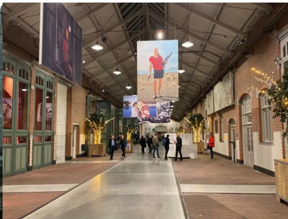
De brede gang in de Hallen