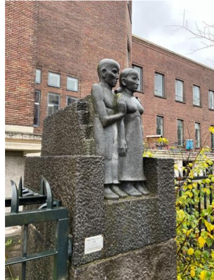
Het beeld Troost, door Hildo Krop

F. Hierna leidt de Jacob van Lennepkade ons terug naar het begin van de route, het WG-terrein, met op de kop het voormalige pathologisch-anatomisch laboratorium. Het pand is ontworpen door architect A.R. Hulshoff, in de stijl van de Amsterdamse School. Ook is op het WG-terrein het werk van kunstenaar Hildo Krop op vele plekken aanwezig. Bij de entree van het voormalige mortuarium aan de Nicolaas Beetsstraat zie je pijlers waarvoor Krop twee beelden maakte: Troost en Herinnering . Troost is overigens een replica, omdat het origineel te veel beschadigd was. In het labgebouw zelf kun je tot slot geestelijke ontspanning vinden bij bioscoop Lab111, Bar Strangelove of bij Lima, het platform voor mediakunst.