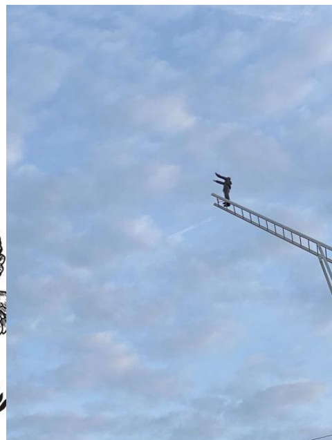
How to Meet an Angel, kunstwerk bij Mentrum.

A. We starten bij de oude entreepoort van het Wilhelmina Gasthuisterrein op Helmersplantsoen 1. Deze plek kent een rijk verleden op het gebied van de geneeskunde. In 1634 arriveerde hier, via de Overtoom, het eerste bootje met pestlijders die in het Pesthuis werden opgenomen, destijds ver weg van de bewoonde wereld. Een eeuw later, in 1734, verzamelden hier de (psychiatrisch) zieken in het Buitengasthuis, dat ook een Dolhuys herbergde, een inrichting voor de opvang van geesteszieken. Wat als een mooi initiatief begon, werd een 'hel op aarde'. Rapportages melden dat er een één arts was op zeventienhonderd patiënten, ongediplomeerde verpleging, en voor de zieken te weinig eten en nauwelijks medicijnen. Gelukkig verbeterde de situatie en legde de tienjarige koningin Wilhelmina in 1891 de eerste steen voor het nieuwe ziekenhuiscomplex, dat hier tot 1983 was gevestigd. Het huidige WG-terrein ontwikkelde zich met de inzet van bewoners en gebruikers. Deze plek biedt nu geestelijke verlichting in de vorm van kunst en cultuur. Behalve kunstenaarsateliers en twee presentatielocaties – WG-Punt en WG Kunst – zijn er een theater en een bioscoop. Via het wandelpad langs het water van de Jacob van Lennepkade, meteen achter het Constantijn Huygens College, kom je op de Pesthuysbrug.