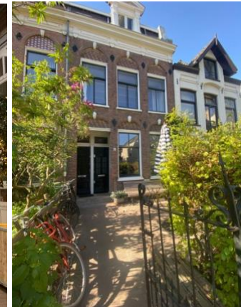
E. de Bellamystraat