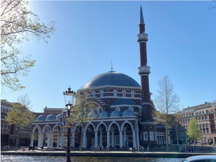
De Westermoskee aan de Kostverlorenkade.

E. Aan het einde van de Bellamystraat loopt de Kostverlorenkade, met aan de overkant de Westermoskee, een huis voor de geest, geleid door de Turks-islamitische organisatie Milli Görüş.