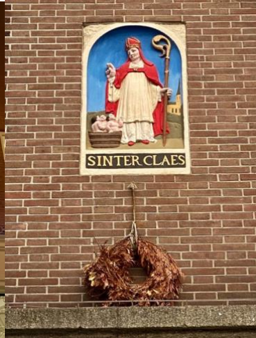
De gevelsteen op de Dam