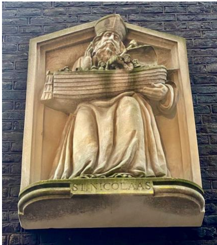
De gevelsteen in de Sint Nicolaasstraat.

B. Ter hoogte van de Sint Nicolaasstraat lag tot de demping van de gracht in 1884 de Sint Nicolaasbrug over de Nieuwezijds Voorburgwal. In de Sint Nicolaasstraat zie je meteen links op de hoek een Sinterklaasgevelsteen waarbij een schip is afgebeeld. Als beschermheilige van zeevaarders was Sint-Nicolaas te hulp geschoten door de zee te kalmeren. In 2020 werd actie ondernomen tegen het drukke (fiets)verkeer in deze straat. Als een soort ode aan de naamgever werd de straat door aanleg van kinderspelletjes in de betegeling verkeersveiliger gemaakt voor de kinderen in de buurt.