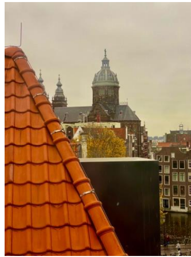
uitzicht op St Nicolaas basiliek