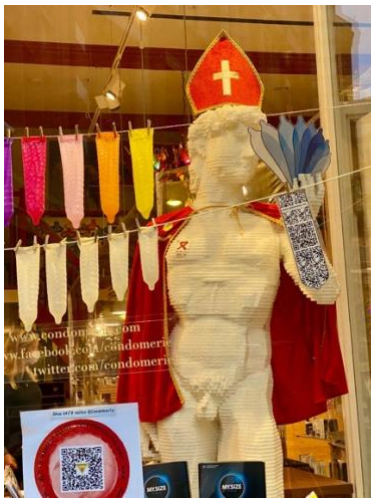
de Condomerie in sinterklaasfeer