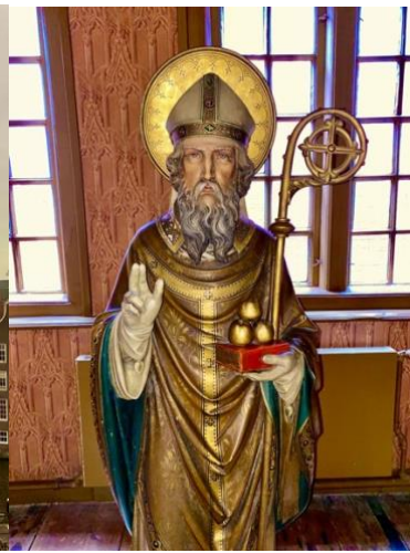
Sinterklaasbeeld in Ons' Lieve Heer op Solder.

F. We slaan af naar de eerste Sint-Nicolaaskerk van de stad, gewijd aan de goedheiligman in 1306, en nu bekend als de Oude Kerk. Als je binnenin goed zoekt, zie je in het gewelf op vijf plekken een sinterklaasbeeltenis.