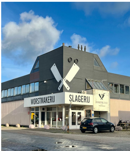
Brandt & Levie.B

A. De wandeling begint dit keer bij de worstleverancier van Amsterdam: Brandt & Levie aan de Archangelkade 9. De buurt waar eens havenarbeiders zwaar werk leverden, is nu de werkplaats voor smaakmakers. De haven is hier gevuld met mode- en reclamebedrijven, horecaleveranciers en productiebedrijven. De oude wegenstructuur langs de kades geeft het gevoel van een industrieterrein, maar de loodsen zijn vervangen door spraakmakende architectuur. We lopen door langs de randen van dit gebied en kijken naar de overkant van het omringende water waar de zware industrie met ronkende schoorstenen nog steeds doet waarmee de havenindustrie zich ook jaren bezighield.